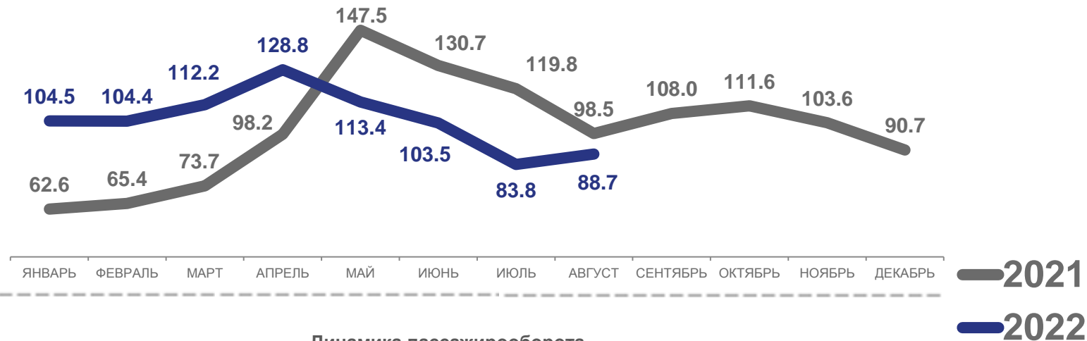
Динамика перевозки пассажиров в % к соответствующему месяцу прошлого года